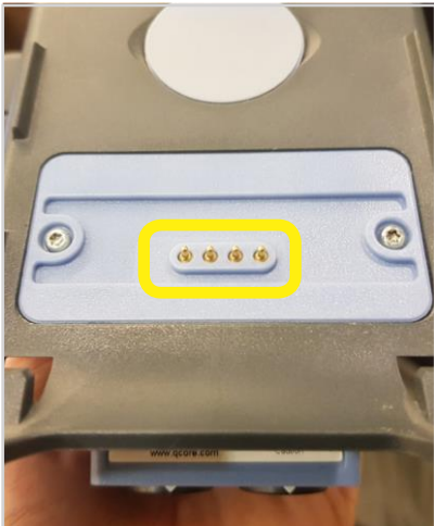
Mini-support avec connecteur de répartition