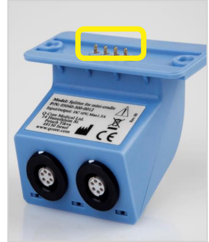
Connecteur de répartition