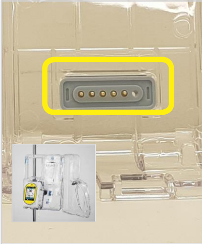
Boîtier de sécurité pour ACP 250 mL