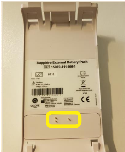
Bloc-piles externe Sapphire