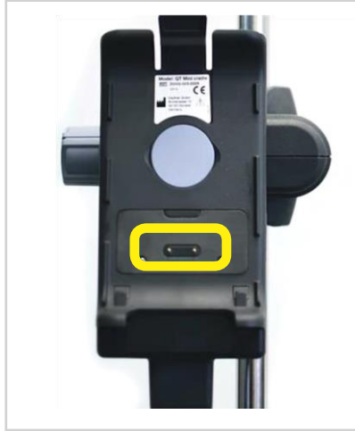
Mini-support avec bloc d'alimentation intégré